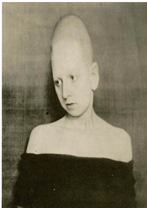
Frontière humaine, autorretrato, 1930

Em 1930, Claude Cahun publica um autorretrato seu, intitulado Frontière humaine , na revista Bifur , edição de número 5. A foto, com o crânio alongado por anamorfose, o peito aplainado e coberto com um pano preto, exacerbando a tridimensionalidade da cabeça, exagerada ainda mais pela ausência de cabelo e a imperceptibilidade das sobrancelhas, centraliza o objeto fotográfico em torno do busto – uma figura sem braços – sua pele extremamente branca em contraste com o fundo escuro, dando um caráter escultórico à figura de Cahun. Diferentemente da maioria de seus autorretratos, o olhar de Cahun evita a câmera; a angulação da cabeça anamórfica, que parece pender devido ao seu tamanho e peso excessivos, pronuncia também o tamanho da orelha. A foto e a sua estranheza – as suas desproporções –, portanto, compõem o índice visível e tátil daquilo que existe entre a fronteira do que podemos chamar aqui de animado e inanimado, humano ou inumano, saudável e doente, feminino ou masculino. Cahun se desveste para se travestir, e a sua pele exposta não nos aproxima do humano, daquilo que seria o mais humano do humano, mas, ao contrário, a sua cabeça se expande, tensionando essa fronteira. É importante lembrar que a palavra “gênero” também designa aquilo que está mais-além da espécie. As dimensões de sua cabeça tornam a experiência de olhar a fotografia estranhamente tátil, mas não podemos saber o que estamos tocando.