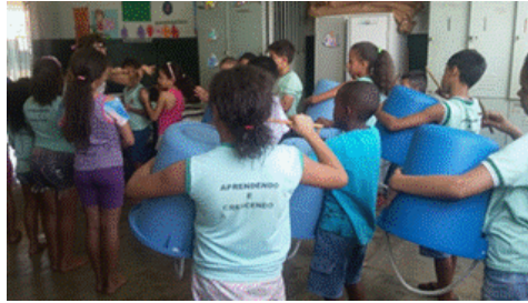
Figura 2: Estudantes participantes do projeto de pesquisa tocando em baldes de plástico / Fonte: acervo pessoal.

acompanhavam a sequência rítmica apresentada/sugerida, enquanto outros/as se movimentavam/percutiam aleatoriamente, sem se importar com o acerto” (DCVI A-14).