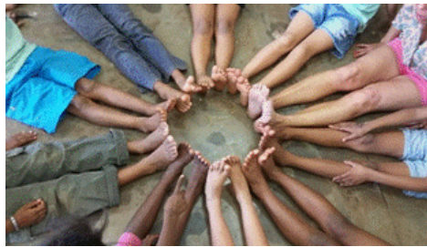
Figura 1: Estudantes participantes do projeto de pesquisa na representação de uma mandala, utilizando o próprio corpo

De modo a ilustrar as atividades realizadas em meio à convivência entre as pessoas participantes nesse projeto de pesquisa, trazemos na Figura 1 uma mandala, figura geométrica que representa a busca de conexão entre as pessoas e o mundo, como representação de uma construção corporal coletiva. Essa atividade não foi de fácil realização, tendo em vista a dificuldade das crianças em encostar lado a lado seus pés, em posição de ponta de pés para cima e ângulo de 90 graus entre calcanhar e chão. Entretanto, promoveu interação entre os participantes, os quais se mostraram curiosos com a figura, novidade em seu cotidiano.