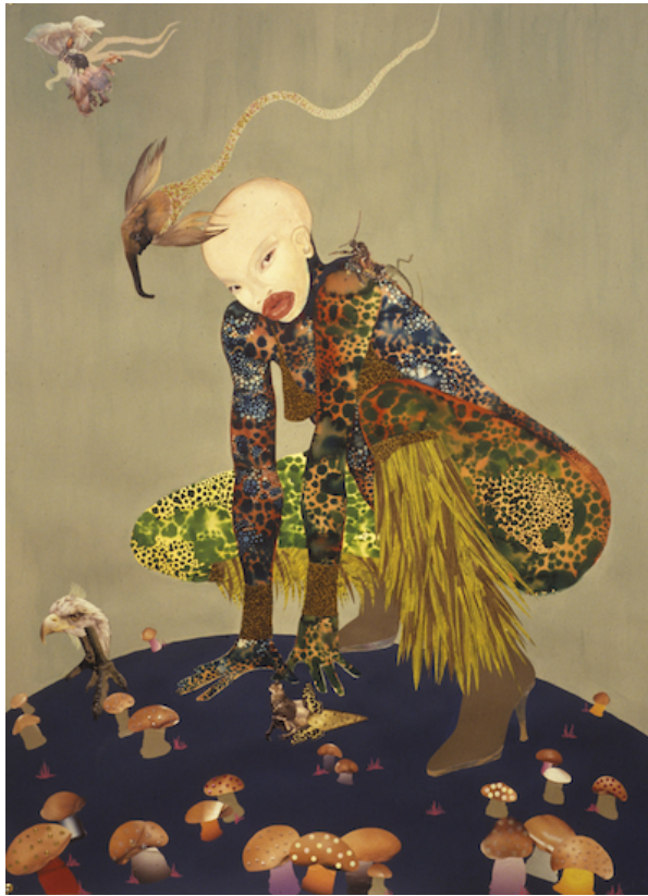
"Riding Death in My Sleep" (2002), da artista contemporânea keniana Wangechi Mutu (nascida em Nairobi, 1972). Collection of Peter Norton, New York. © Wangechi Mutu

Disponível em: ver https://www.artsy.net/artwork/wangechi-mutu-riding-death-in-my-sleep