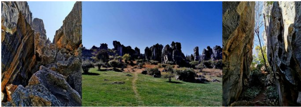
Floresta de Pedras, Shilin