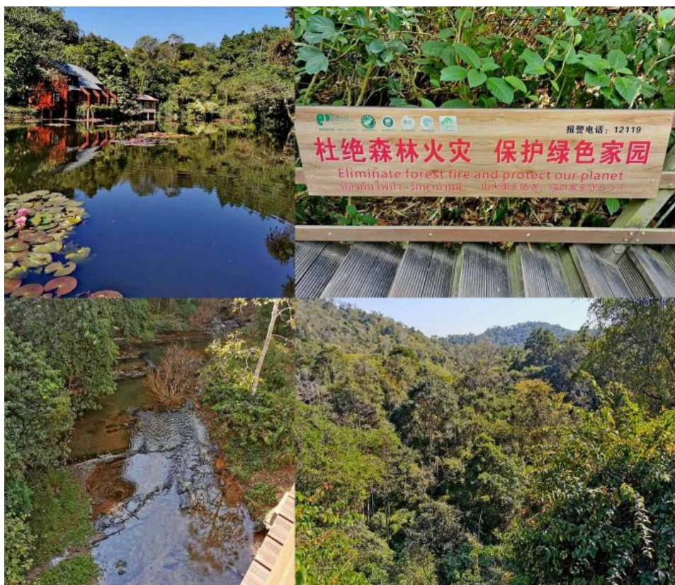
Vale dos Elefantes, Sancha He

Saudades! Sempre discordei dessa mitologia que atribui essencialismo lusófono intraduzível à palavra “saudades”. Toda tradução, toda traição, toda transculturação serão sempre possíveis, basta o gesto da troca, do desejo de comunhão igualitária.