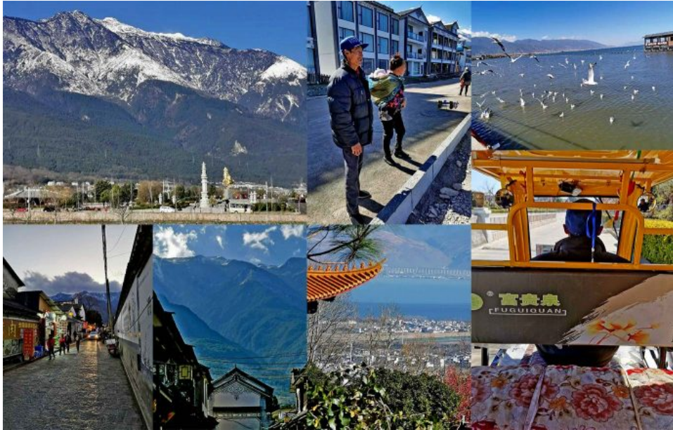
Dali