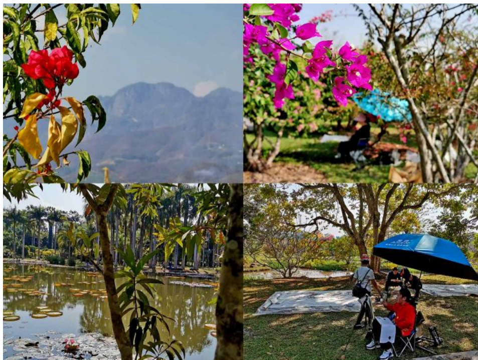
Parque botânico tropical, Menglun

Xishuangbanna, nome comprido, afetos largos: na reserva ambiental de Sancha He, em quase tudo idêntica a uma floresta úmida amazônica, a não ser pelos seus visitantes ilustres, elefantes selvagens, que hoje escasseiam; no gigantesco parque botânico tropical, em Menglun, que nos confronta com essa sua estranhíssima familiaridade e sublime beleza, palco de muitos desenhistas e pintores. Minha China Tropical é toda essa paisagem em movimento amplo e lento, agitado e sereno, ruidoso e pacífico. Ficou lá atrás e lá embaixo. Mas mora aqui no coração sem palavra.